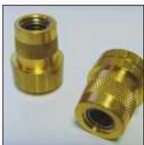
Opcija A: SAE post