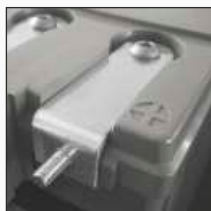
Opcija B: M6 muški prednji adapter terminala